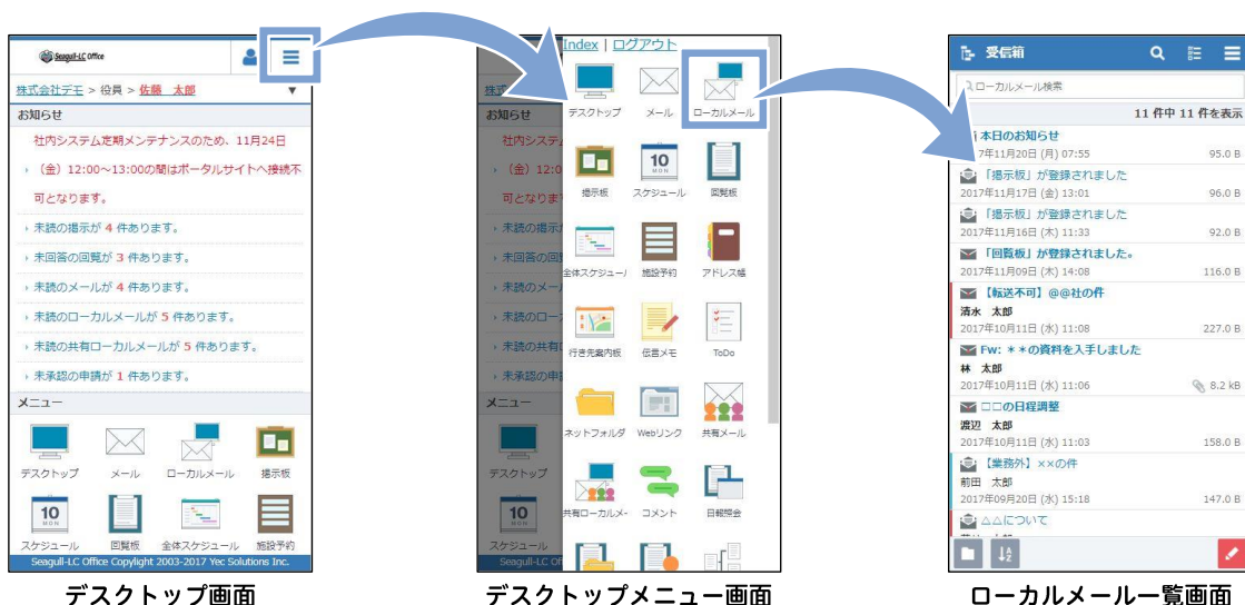
デスクトップ画面